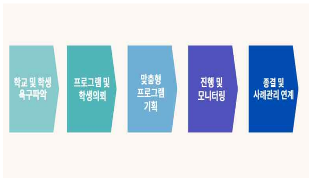
[ 내 용 ]