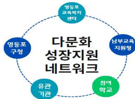
[ 참 여 기 관 ]